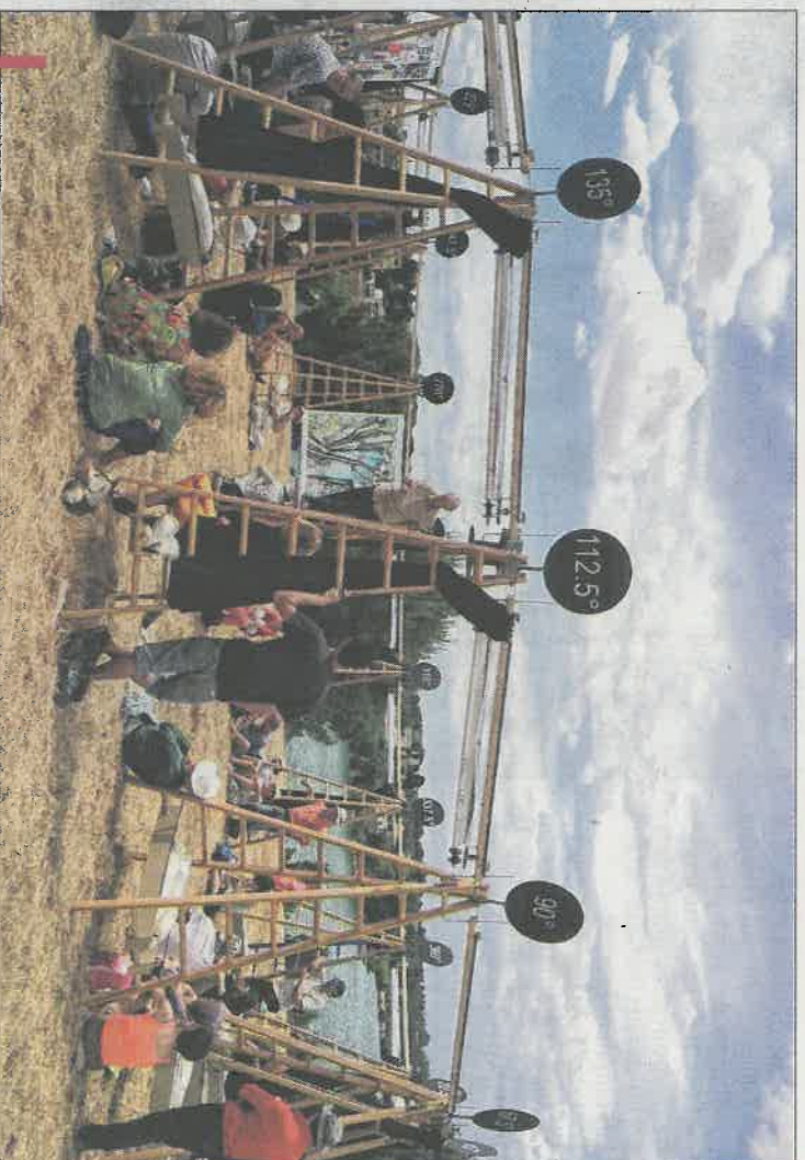
Plusieurs dizaines de personnes ont rallié la colline du Castellan pour une leçon sur "le pli de la carte"

van Welden pour déployer le troisième volet de son projet Saturn , qui entend concilier lecture de paysage et performances artistiques. Huit cabanons en bois sont ainsi disséminés sur le plateau, à côté de la vigie, munis chacun d'une jumelle bi ou monoculaire pouvant porter jusqu'à 4km. Entre l'étang de Berre et les cheminées d'ArcelorMittal, le visiteur met d'abord sur les oreilles un casque d'où sort des sons créés ex-priès, puis pose son œil sur l'optique. Soudain, un personnage apparaît, homme ou femme se déplaçant dans le paysage. Une prestation insolite, à vivre encore aujourd'hui. Et pour ceux qui seraient intéressés de suivre les prestations de Karl van Welden, il récidivera