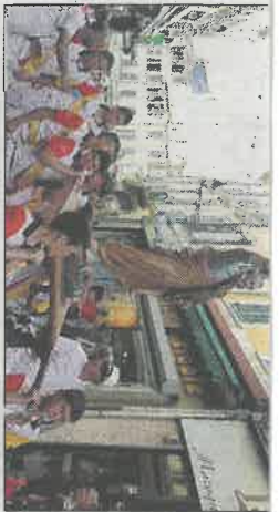
La fête de la Saint-Pierre a été célébrée hier à Martigues, aussi bien sur terre qu'en mer. P.3