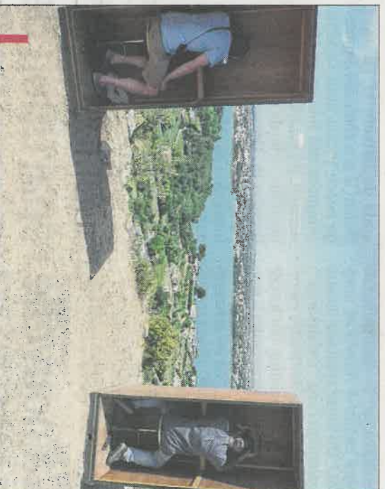
Si le vent se calme, l'accès à l'installation "Saturn III" sur la colline Saint-Étienne devrait être possible toute la journée.

D'autres propositions n'avaient lieu qu'une fois comme, hier après-midi, sur la colline du Castellan, un nouvel épisode du projet Echelle 1 , lui aussi initié par MP2013. Une manière ludique d'appréhender les cartes topographiques ou routières. L'artiste marcheur anglo-américain Jeremy Wood, véritablement obsédé par ses déplacements dès qu'il sort de chez lui, en a fait un mode de vie plastique alimenté par la technologie du GPS. Après ses explications captivantes in situ , le groupe des promeneurs a fait cercle pour participer à une conférence illustrée sur "le pli de la carte" avant un joyeux atelier participatif. Patrick MERLE